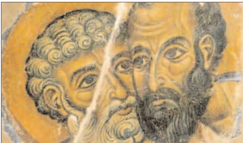
Image : Baiser de Pierre et Paul - Réseau Culture et foi

Journal web bimensuel qui vise à faire connaître des parcours et des lieux où se vivent des expériences humaines et spirituelles novatrices.